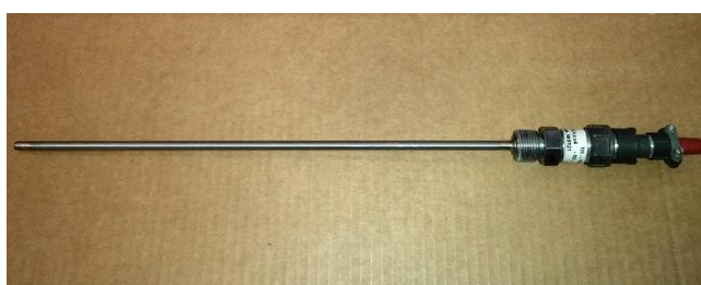
Рисунок 5 - Термопреобразователь сопротивления ТП-9201