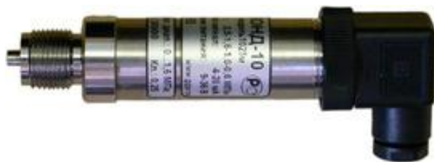
Рисунок 3 - Преобразователь измерительный давления ЗОНД-10