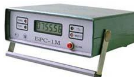
Рисунок 10 - Барометр рабочий сетевой БРС-1М-1