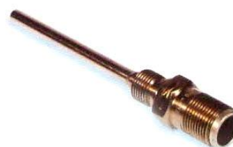
Рисунок 6 - Термопреобразователь сопротивления П-77 вар. 2