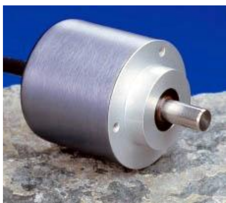
Рисунок 7 - Датчик углового перемещения (энкодер)