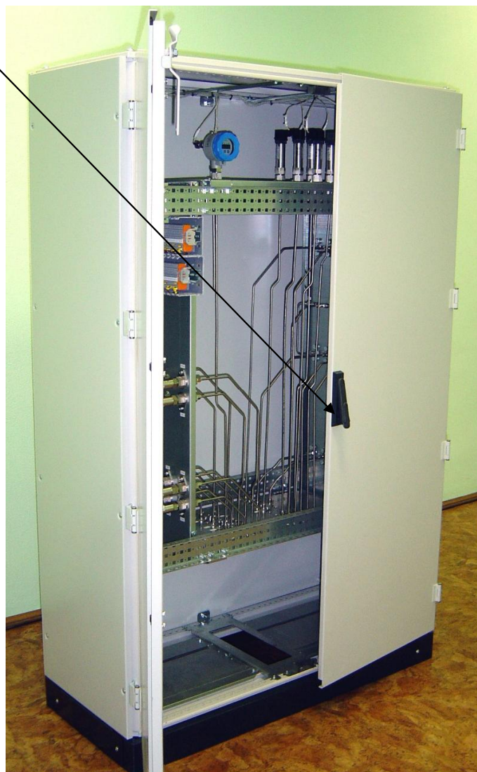
Рисунок 2 - ШИП