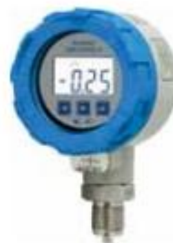
Рисунок 4 - Преобразователь давления измерительный AIR-20/M2