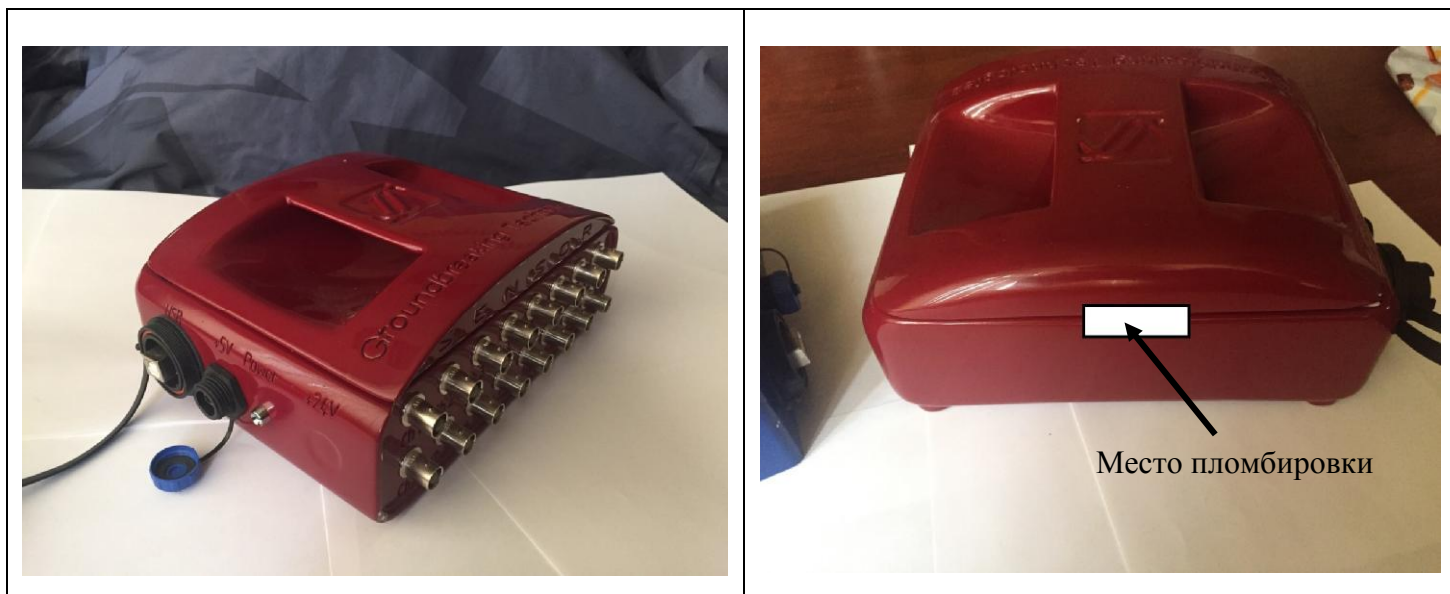
Рисунок 2 - Внешний вид УМС-16-02 (UMS-16-02), схема пломбировки от несанкционированного доступа и место нанесения знака утверждения типа