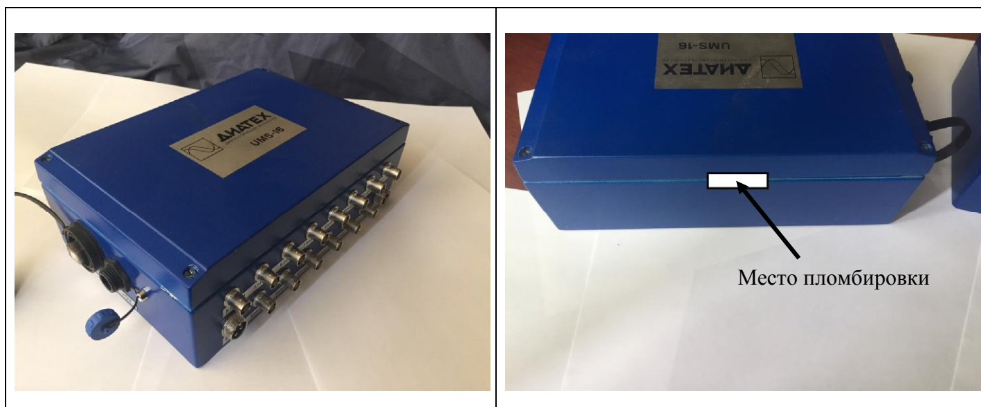
Рисунок 1 - Внешний вид УМС-16-01 (UMS-16-01), схема пломбировки от несанкционированного доступа и место нанесения знака утверждения типа

Фотографии внешнего вида модификаций УМС-16 (UMS-16) приведены на рисунках 1, 2, 3.