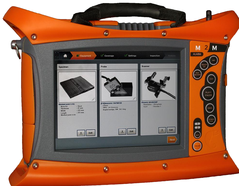
Рисунок 1 - Общий вид дефектоскопов

Схема пломбировки от несанкционированного доступа представлена на рисунке 2.