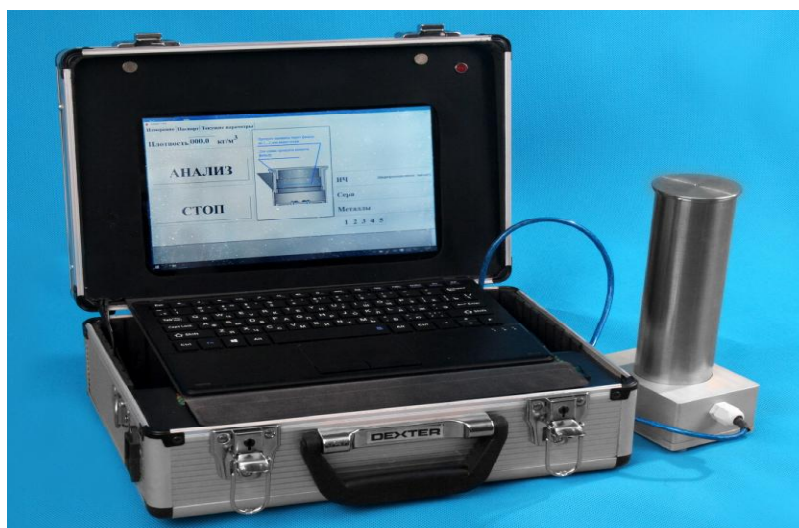
Рисунок 1 - Общий вид экспресс-анализаторов ЭЛМЕР-001

Место пломбировки показано стрелкой на рисунке 2.