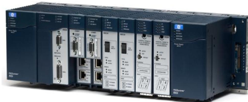
Рисунок 1 - Внешний вид контроллера GE IP серии RX3i

Внешний вид контроллера GE IP серии RX3i представлен на рисунке 1, внешний вид модулей серии RX3i в шкафу представлен на рисунке 2. Метрологические и технические характеристики системы представлены в таблицах 2, 3.