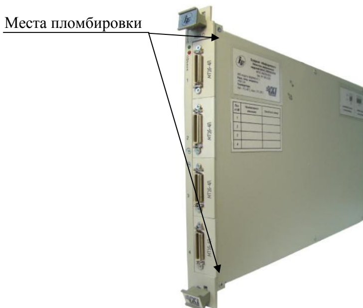
Рисунок 3 - Схема пломбировки от несанкционированного доступа измерителей, установленных в носитель мезонинных модулей НМ-С