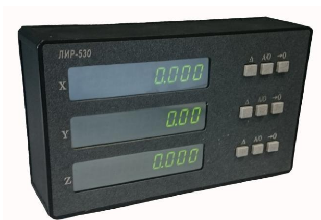
Рисунок 3 - Устройство цифровой индикации