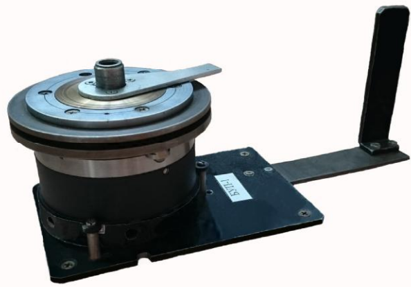
Рисунок 2 - Блок измерений угловых перемещений БУП-1