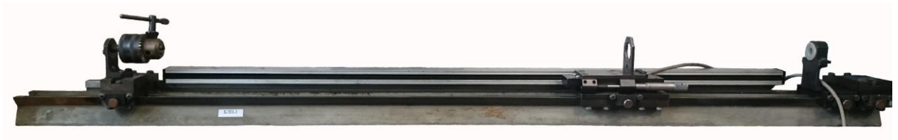
Рисунок 1 - Блок измерений линейных перемещений БЛП-1