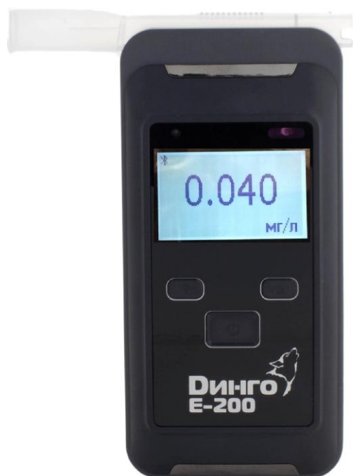
Рисунок 1 - Общий вид анализатора с принтером

Общий вид анализаторов и пример распечатанного протокола измерения представлен на рисунках 1-2.