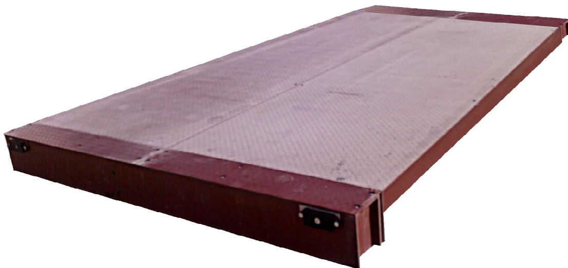
Рисунок 1 - Общий вид ГПУ весов для статического взвешивания СТА

Общий вид датчика весоизмерительного тензорезисторного типа ZSFY представлен на рисунке 3.