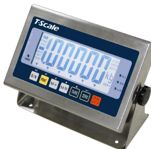
Рисунок 2 - Общий вид терминала CWS