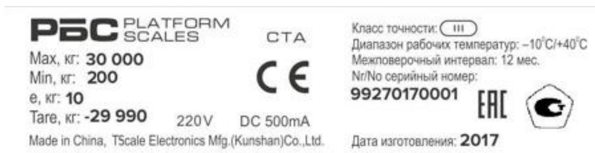
Рисунок 4 - Маркировочная табличка весов для статического взвешивания СТА

Изображение маркировочной таблички весов для статического взвешивания СТА представлено на рисунке 4.