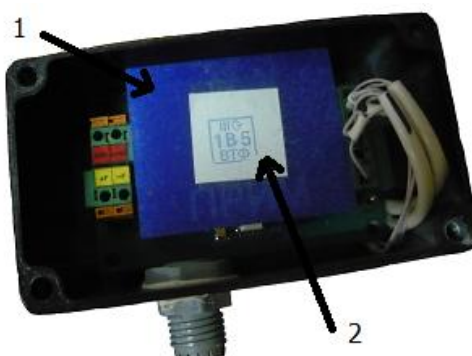
Схема пломбировки ПРИМ-«П» и ИМ2300 от несанкционированного доступа, обозначение места нанесения знаков поверки на ПРИМ-«П» и ИМ2300 представлены на рисунках 2 и 3.

1 – пломбировочная пластина; 2 – знак поверки