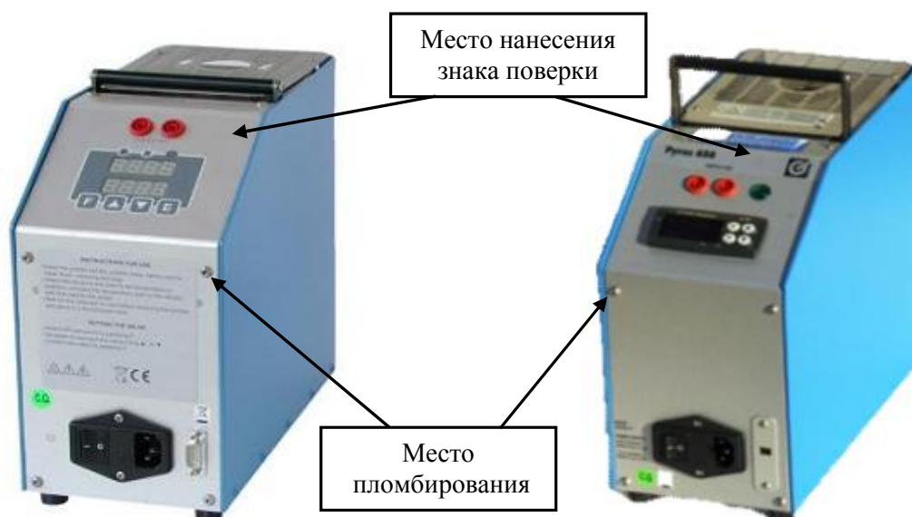
а) исполнения PYROS 140, PYROS 375, PYROS 650