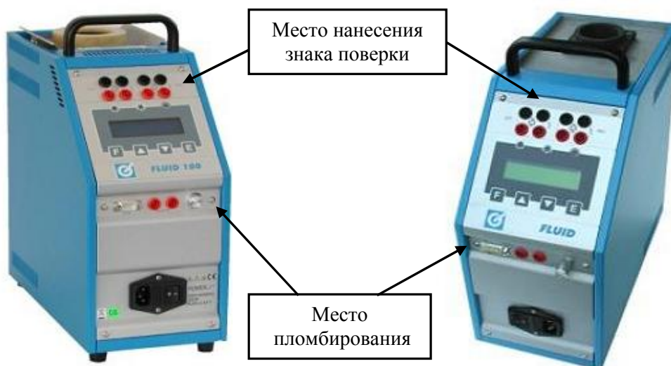
в) исполнения FLUID100 и FLUID H100