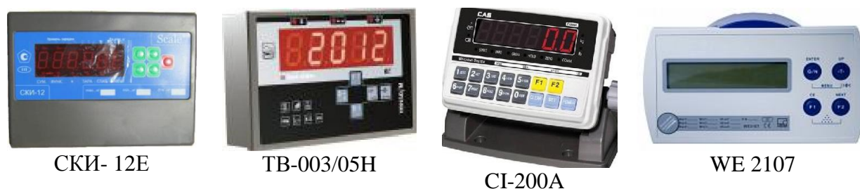
Рисунок 3 - Общий вид приборов весоизмерительных