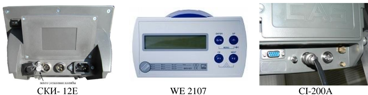
Рисунок 4 - Места пломбировки приборов весоизмерительных