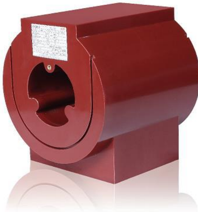
Рисунок 1 - Общий вид средства измерений

Место пломбировки от несанкционированного доступа и обозначение места нанесения знака поверки представлены на рисунке 2.