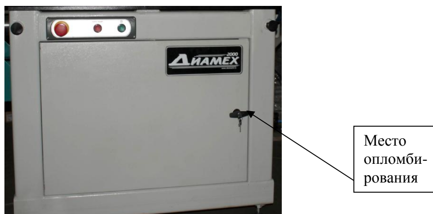
Рисунок 2 - Вид спереди шкафа управления и схема пломбировки от несанкционированного доступа