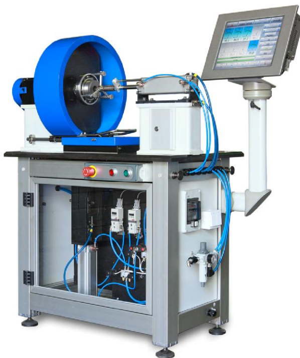
Рисунок 1 - Общий вид станка специального вибродиагностического СП-180М

Общий вид станка специального вибродиагностического СП-180М представлен на рисунке 1. Вид спереди шкафа управления и схема пломбировки от несанкционированного доступа представлен на рисунке 2. Вид сзади корпуса механизма подачи осевой нагрузки с местом крепления маркировочной таблички и нанесением знака утверждения типа представлен на рисунке 3.