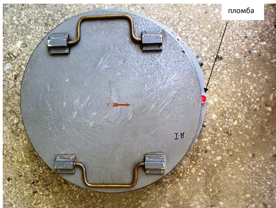
Рисунок 2 - Схема пломбировки от несанкционированного доступа СИАЗ-3

Для защиты от несанкционированного доступа выполнено опломбирование головок винтов на корпусе СИАЗ-3.