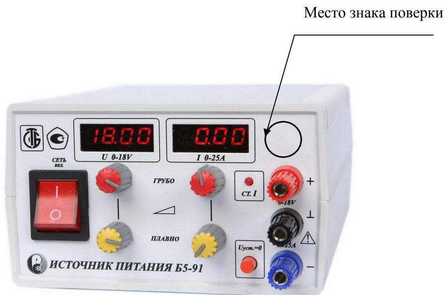
Рисунок 2 - Место нанесения знака поверки с лицевой стороны ИП