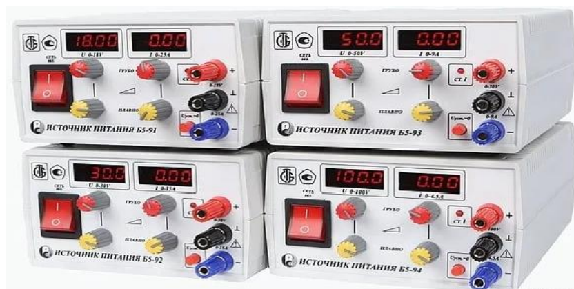
Рисунок 1 - Общий вид источников питания постоянного тока Б5-91, Б5-92, Б5-93, Б5-94

Места нанесения знака поверки приведены на рисунках 2 и 3.