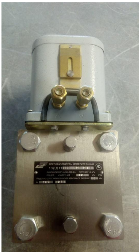
Рисунок 1 - Внешний вид преобразователя пневматического разности давлений 13ДД11