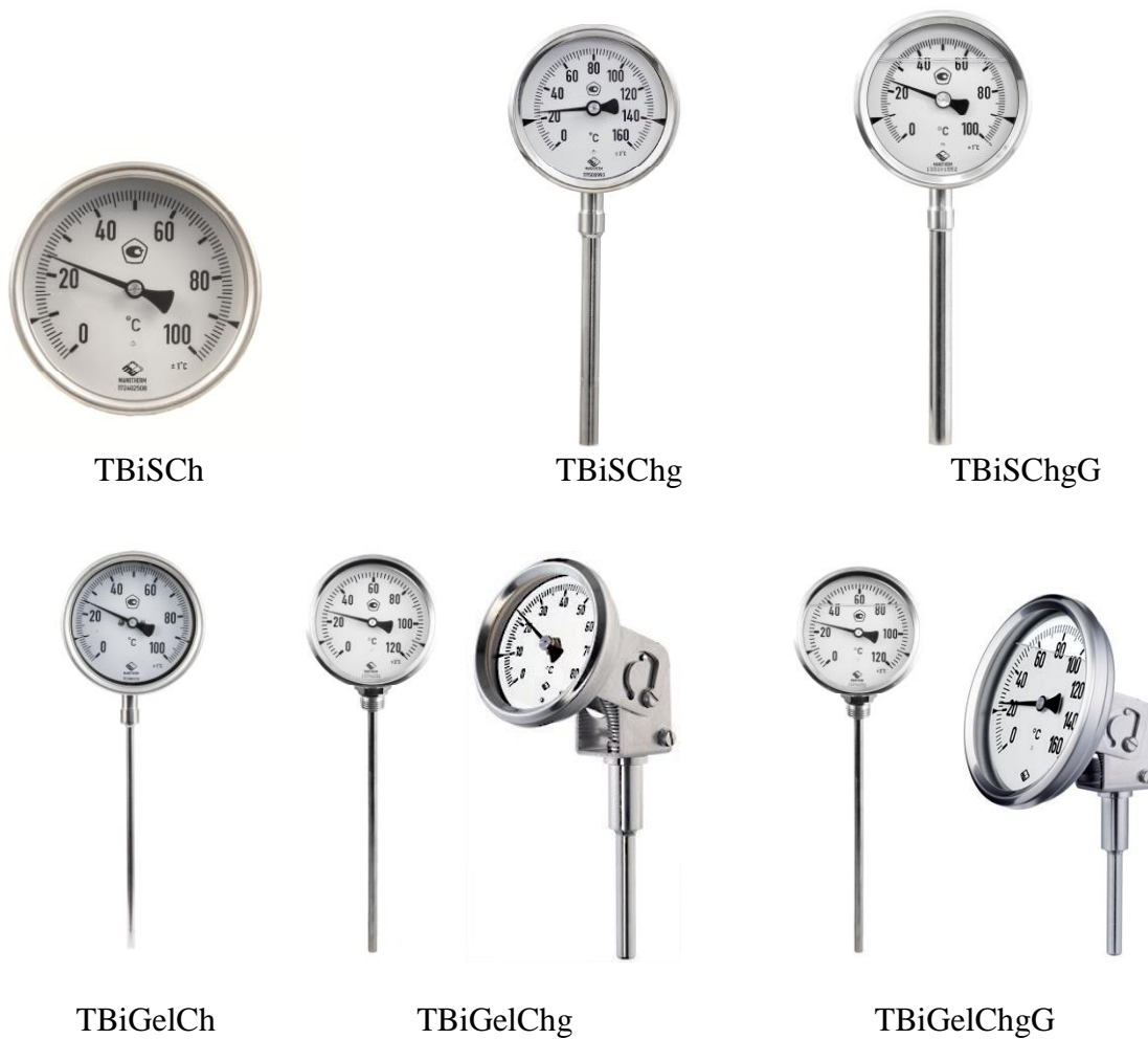
Рисунок 1 - Общий вид термометров