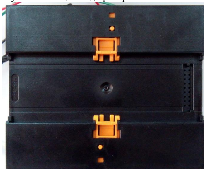
Рисунок 2 - Вид крепления преобразователей на DIN-рейке