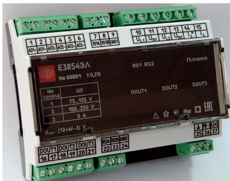
Рисунок 1 - Общий вид преобразователей E3854ЭЛ