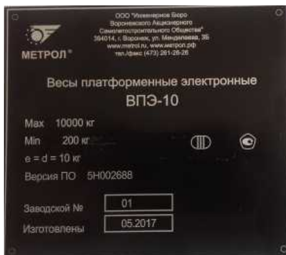
Рисунок 3 - Маркировка весов ВПЭ