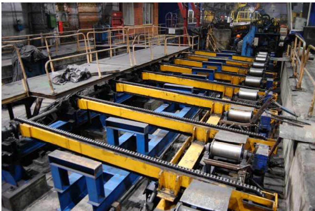
Рисунок 1 - Общий вид грузоприемного устройства

Весы состоят из грузоприемного устройства, включающего весоизмерительные тензорезисторные датчики RTN-4,7 С3, и терминала DISOMAT. Терминал служит для управления весами посредством функциональной клавиатуры. Результат измерений отображается на цифровом дисплее терминала.