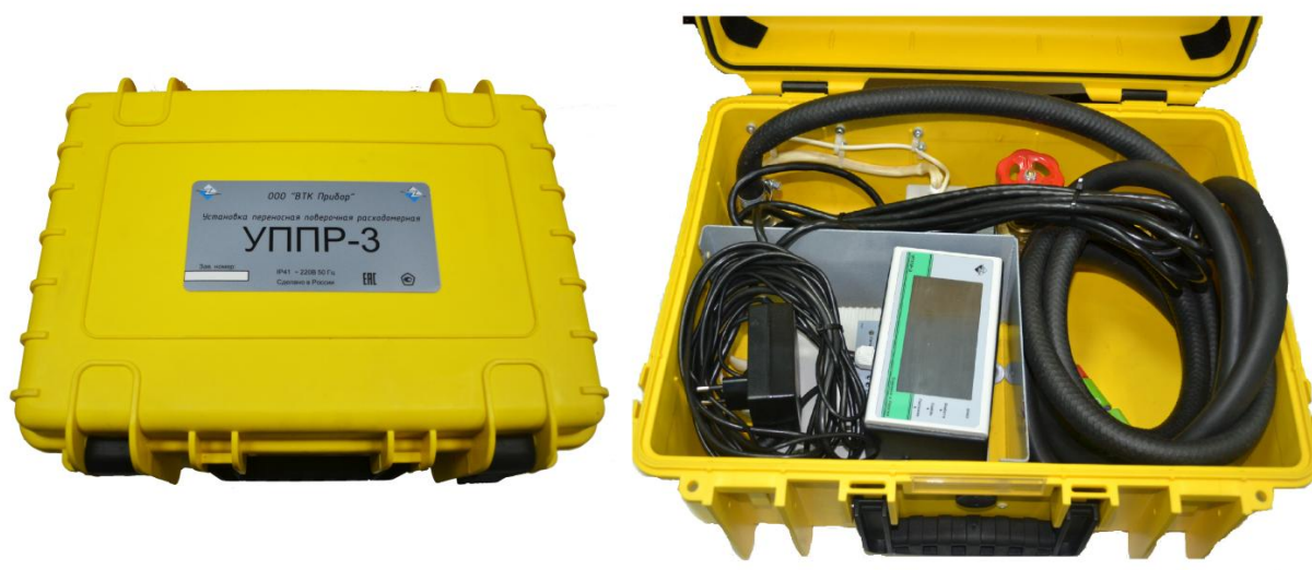
Рисунок 1 - Общий вид установок переносных поверочных расходомерных УППР-3

Общий вид установок переносных поверочных расходомерных УППР-3 приведен на рисунке 1.