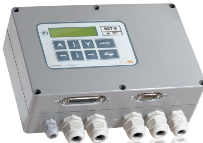
Рисунок 1 - Общий вид вычислителя

В целях предотвращения несанкционированного доступа к узлам регулировки и к ПО, а также к элементам конструкции, предусмотрены места пломбирования, указанные на рис. 2.