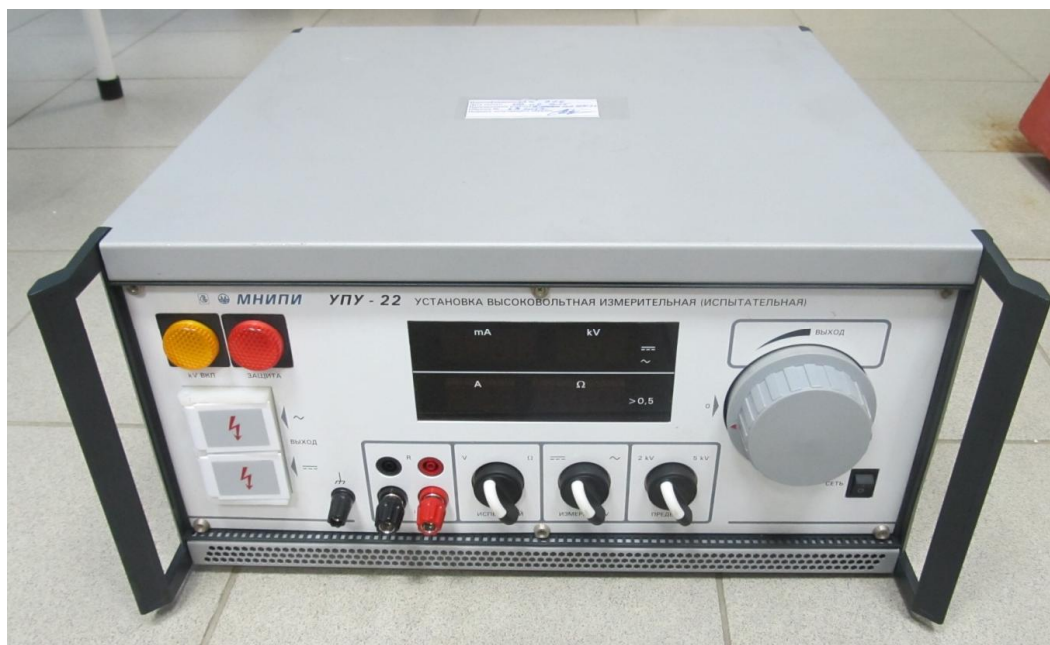
Рисунок 1 - Общий вид установки

Схема пломбирования установки от несанкционированного доступа с указанием мест нанесения знака поверки и оттисков клейм ОТК приведена на рисунках 2 и 3.