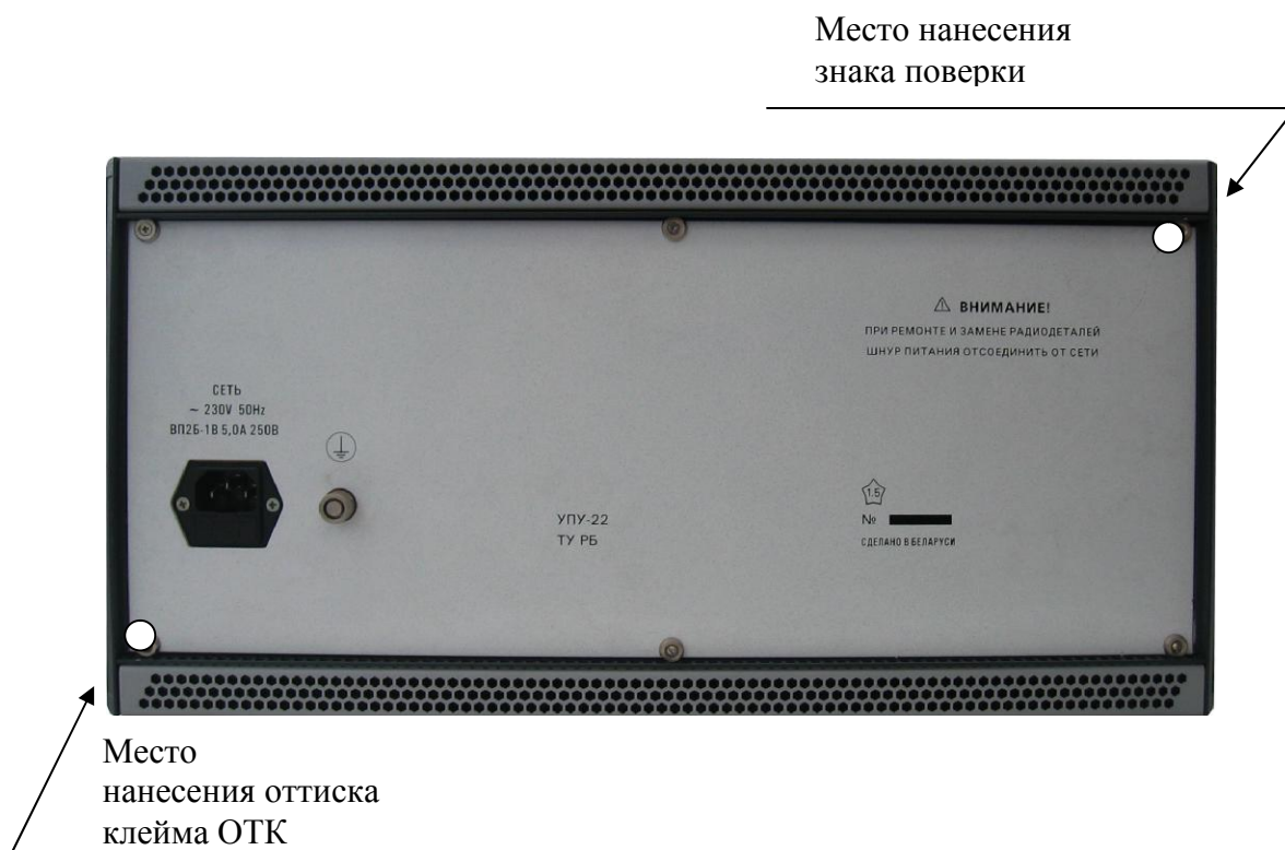
Рисунок 2 - Место нанесения знака поверки и отиска клейма ОТК (вид установки сзади)