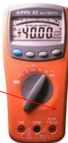
APPA 80, APPA 82, APPA 82R