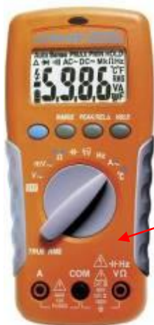
APPA 66R, APPA 66RT