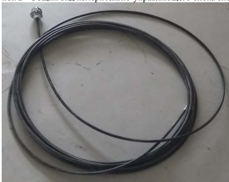
Рисунок 3 - Общий вид термоподвесок

Проектная компоновка (состав) системы, место установки термоподвесок и заводские номера компонентов системы приведены в таблице 1.