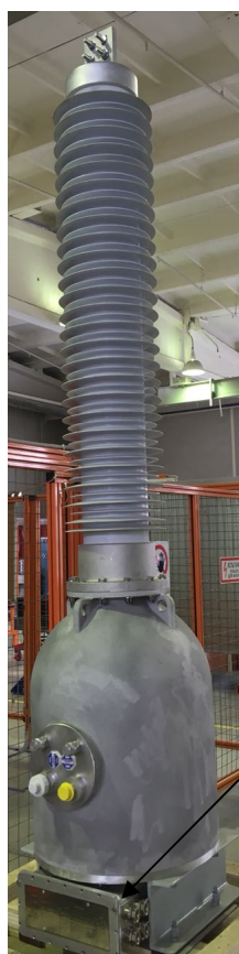
Рисунок 1 - Общий вид трансформаторов

Общий вид трансформаторов представлен на рисунке 1, общий вид клеммной коробки с обозначением места пломбирования от несанкционированного доступа представлен на рисунке 2.