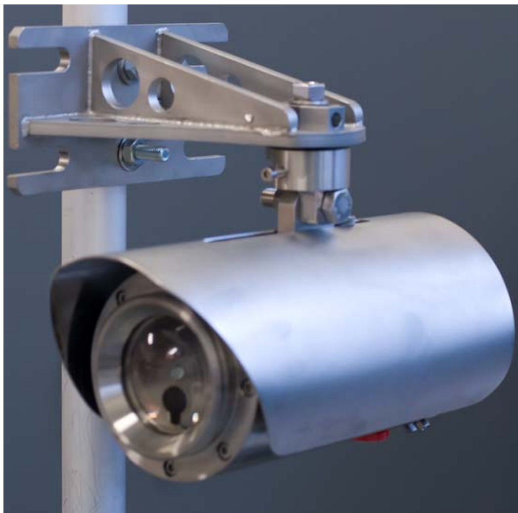
а) блок приемника

Общий вид газоанализаторов представлен на рисунке 1, схема пломбирования корпуса газоанализаторов от несанкционированного доступа представлена на рисунке 2.