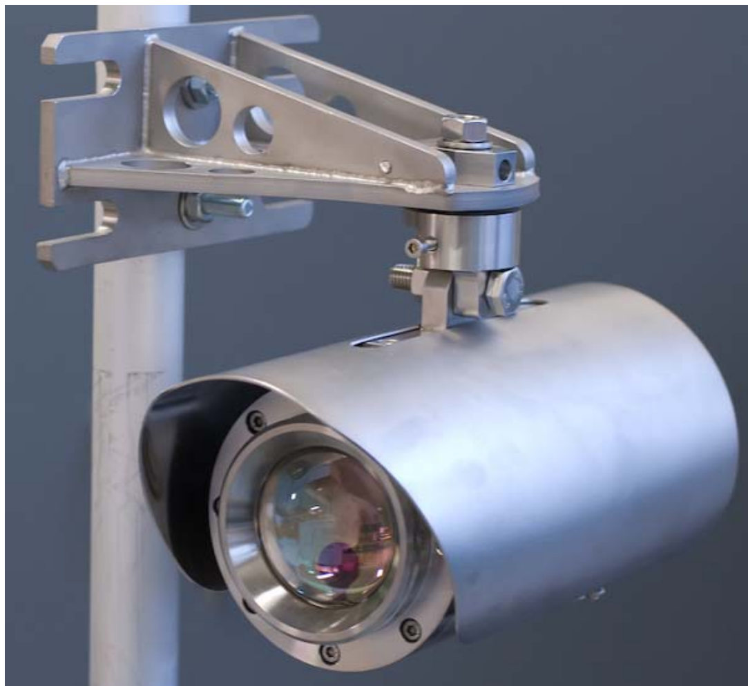
б) блок передатчика