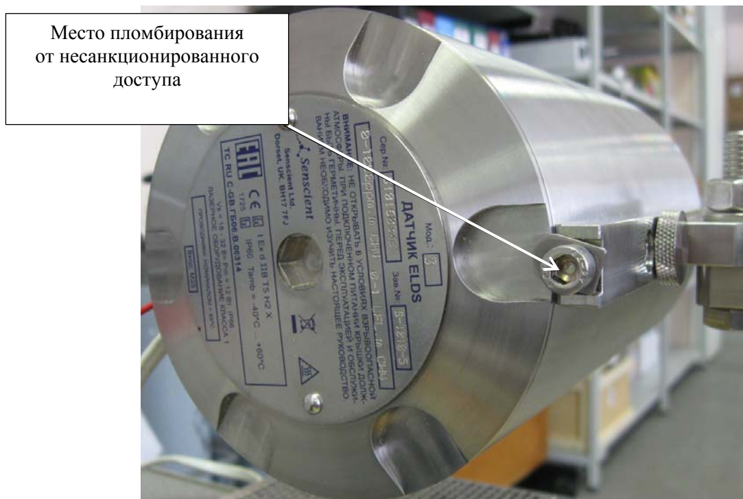
Рисунок 2 - Схема пломбирования газоанализаторов от несанкционированного доступа