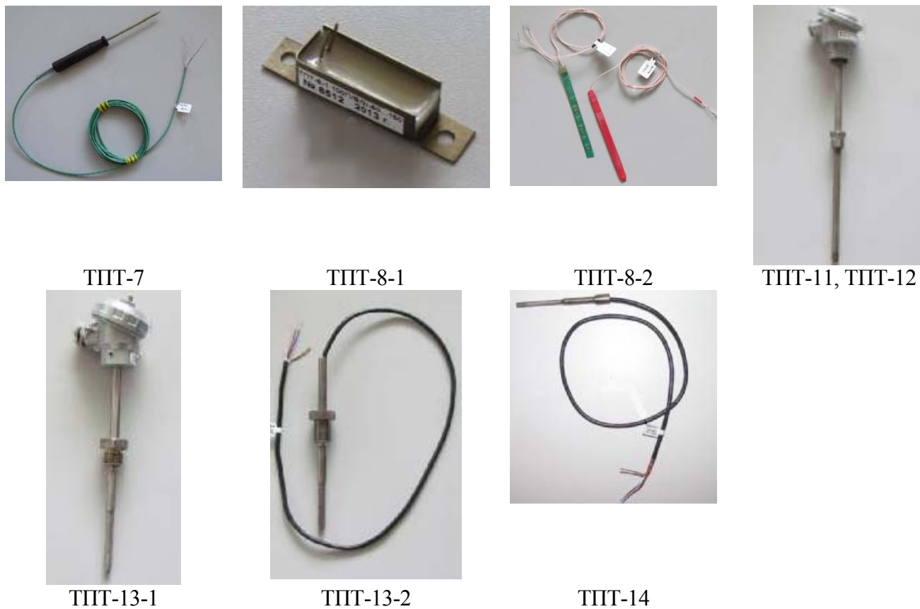
Рисунок 3 - Термопреобразователи сопротивления их комплекты