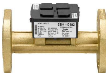
Sono 1500 CT