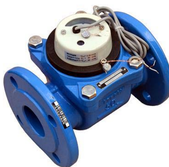
ВСХН, ВСХНд, ВСГН, ВСТН (Рег. номер 40606-09)