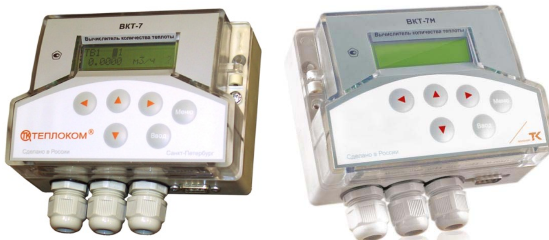
Рисунок 1 - Вычислители количества теплоты ВКТ-7 и ВКТ-7М

Общий вид составных частей теплосчетчиков приведен на рисунках 1-5.