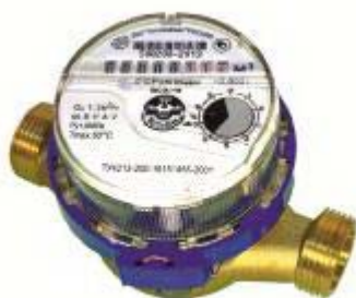
ВСХН, ВСХНд, ВСГН, ВСТН (Рег. номер 61402-15)