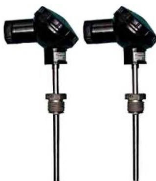
КТПТР-04, КТПТР-05, КТПТР-05/1