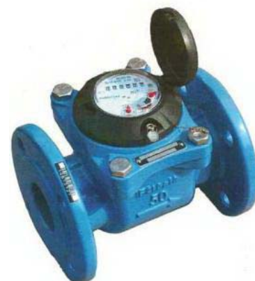
ВСХН, ВСХНд, ВСГН, ВСТН (Рег. номер 61401-15)