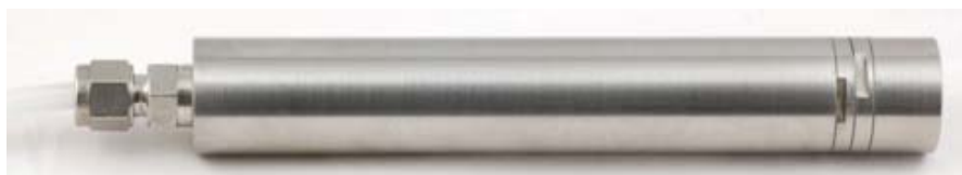
Рисунок 2 - Общий вид датчиков давления волоконно-оптических серии OSP-551