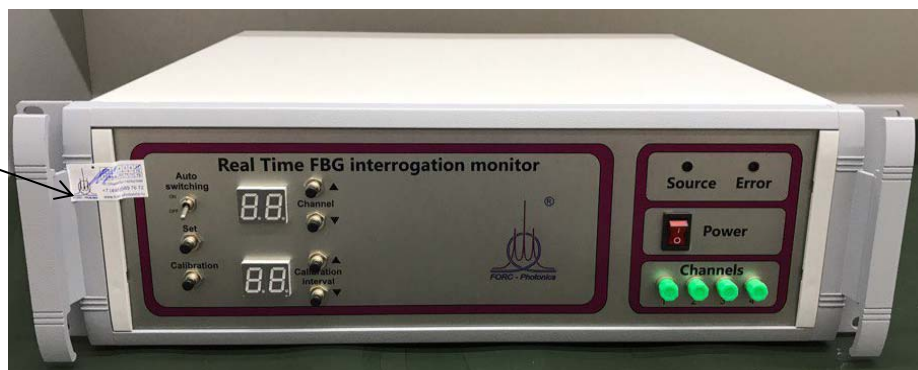
Рисунок 3 - Общий вид УРМ и место пломбирования