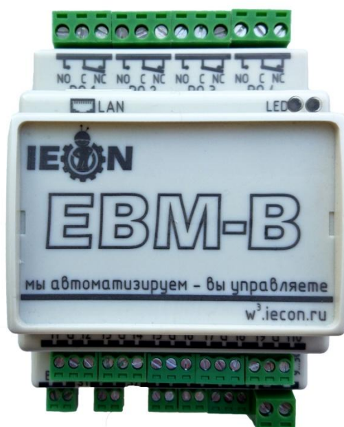
Рисунок 2 – Общий вид модуля ЕВМ-В, модификация ЕВМХ-ХХА604Х-МОД-В

Конструкция модулей ЕВМ-В, СРМ-С обеспечивает ограничение доступа к определенным частям в целях предотвращения несанкционированной настройки и вмешательства путем пломбировки. Пломбировка производится на боковых панелях модулей пломбирующими наклейками.