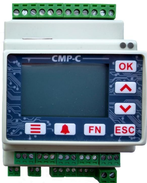
Рисунок 1 – Общий вид модуля СРМ-С, модификация СРМС-ХХА604Х-ВХХ-В