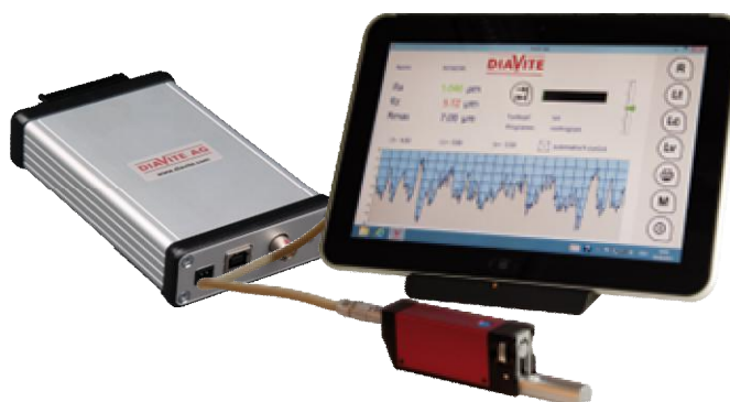
Рисунок 4 - Общий вид прибора DIAVITE DH-8/App

Дополнительная комплектация: опорные щупы: для малых отверстий VH, для проточек NH, для острых кромок AH, для выпуклых и вогнутых деталей KKH, для зубчатого колеса ZH, поперечный щуп QH. Привод подачи безопорных щупов VHF. Безопорные щупы: BZFH, для проточек NFH-2, для кромок режущего инструмента AFH. Модуль ПО DIASOFT Standard (дополнительно анализ волнистости и шероховатости профиля, функции масштабирования, симметрии, сравнение профилей), модуль ПО DIASOFT AUTOMOTIVE (контроль параметров шероховатости по методу Motif), модуль ПО DIASOFT EXPERT (измерение и анализ микротопографии), модуль ПО DIAVITE Kontur (для измерения и анализа геометрических параметров контура) с комплектом щупов. Измерительная стойка с гранитным (металлическим) основанием, измерительный стол для позиционирования детали, устройство для позиционирования привода.