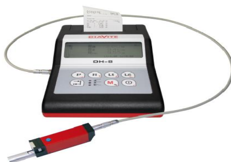
Рисунок 2 - Общий вид прибора DIAVITE DH-8

Дополнительная комплектация: опорные щупы: для малых отверстий VH, для проточек NH, для острых кромок AH, для выпуклых и вогнутых деталей KKH, для зубчатого колеса ZH, поперечный щуп QH. Привод подачи безопорных щупов VHF. Безопорные щупы: BZFH, для проточек NFH-2, для кромок режущего инструмента AFH. Модуль ПО DIASOFT Standard (дополнительно анализ волнистости и шероховатости профиля, функции масштабирования, симметрии, сравнение профилей), модуль ПО DIASOFT AUTOMOTIVE (контроль параметров шероховатости по методу Motif), модуль ПО DIASOFT EXPERT (измерение и анализ микропографии). Измерительная стойка с гранитным (металлическим) основанием, измерительный стол для позиционирования детали, устройство для позиционирования привода.