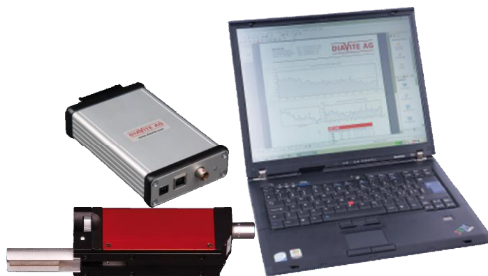
Рисунок 3 - Общий вид прибора DIAVITE DH-8/PC

DIAVITE DH-8/App (для работы с планшетным ПК):