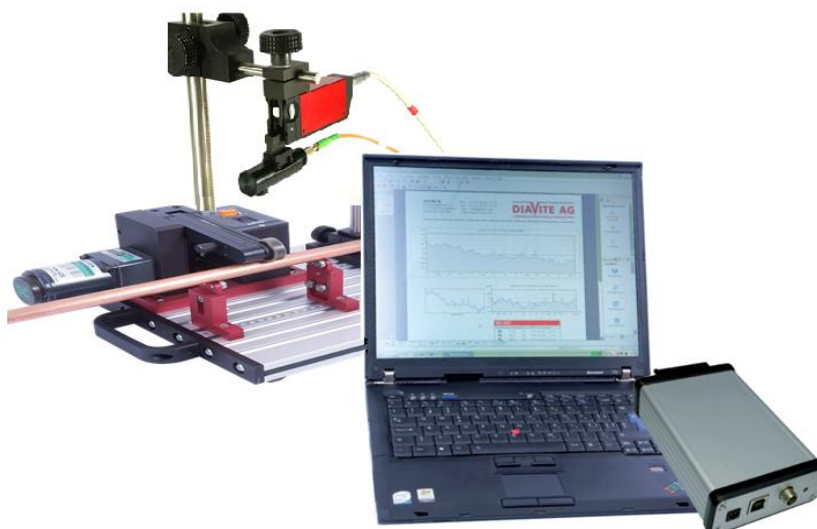
Рисунок 4 - Общий вид прибора DIAVITE OPTIC

Пломбирование приборов не предусмотрено.