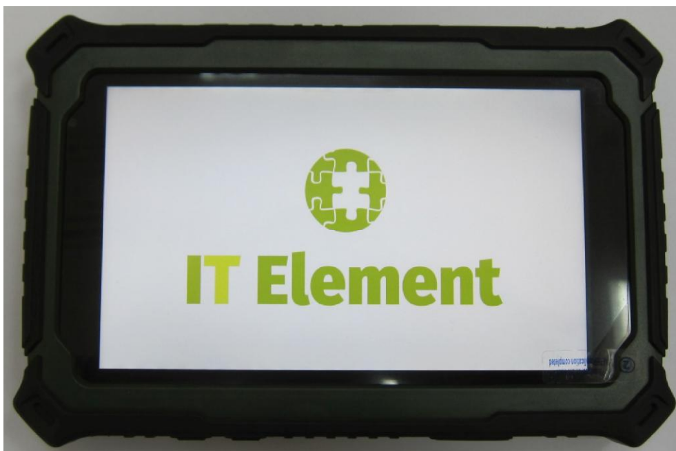
Рисунок 1 - Общий вид комплекта измерительного значения текущего времени с фотофиксацией «КФ-01»

Компьютерный блок обеспечивает формирование фотоотчётов, содержащих фотоснимки и служебную информацию (точные навигационные координаты, значение текущего времени, текстовые примечания), и передачу информации на внешние накопители по проводам или беспроводным каналам связи.