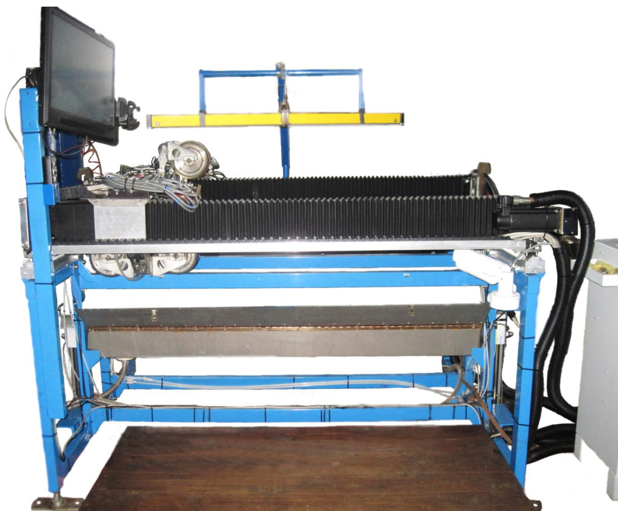
Рисунок 1 – Общий вид комплексов