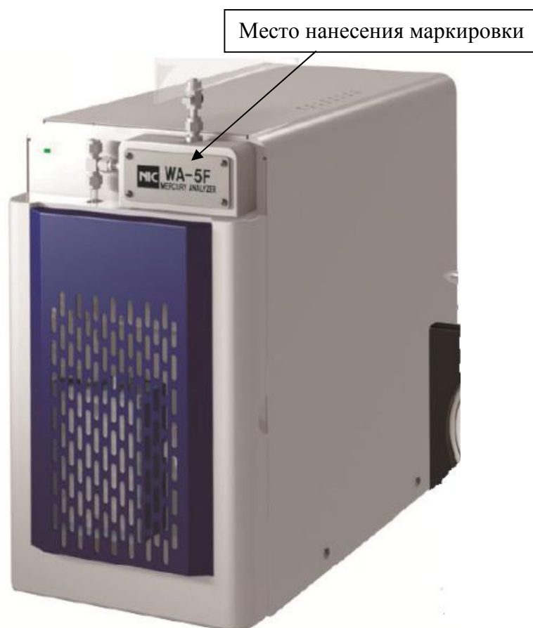
Рисунок 1 - Общий вид анализаторов ртути с указанием места нанесения маркировки

Схема пломбировки от несанкционированного доступа, обозначение места нанесения знака поверки представлены на рисунке 2.