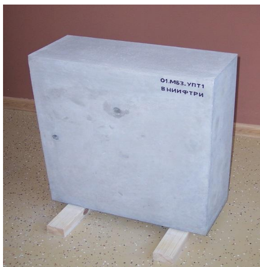
Рисунок 2 – Общий вид мер бетонных МБ3, МБ4

Обозначение торцевых поверхностей мер бетонных представлено на рисунке 3.