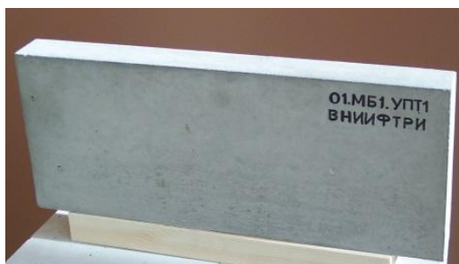
Рисунок 1 – Общий вид мер бетонных МБ1, МБ2

Общий вид мер бетонных представлен на рисунках 1 и 2.