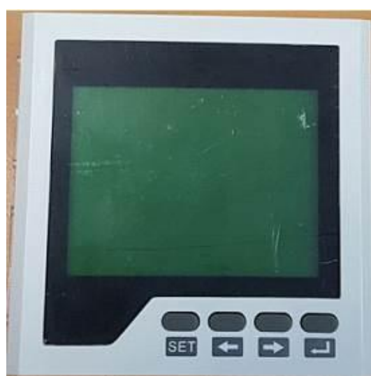
Рисунок 11 – Общий вид приборов ЦП-МИПС