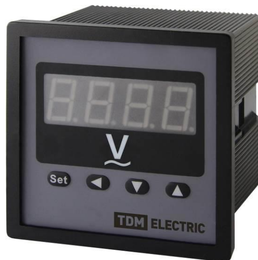
Рисунок 5 – Общий вид приборов ЦП-В72