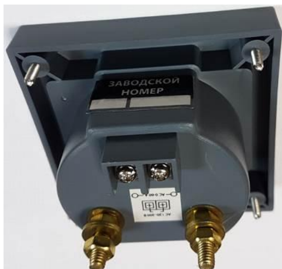
Рисунок 13 – Общий вид приборов ЦП. Вид сзади