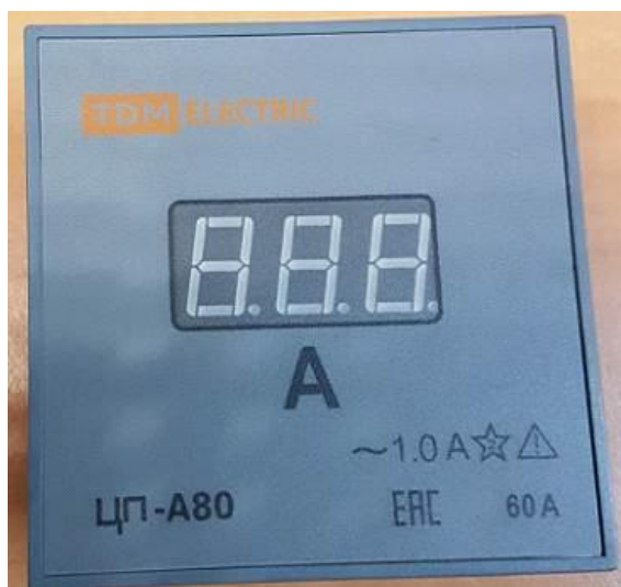
Рисунок 8 – Общий вид приборов ЦП-А80