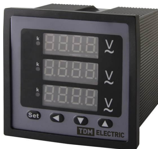
Рисунок 7 – Общий вид приборов ЦП-В72×3