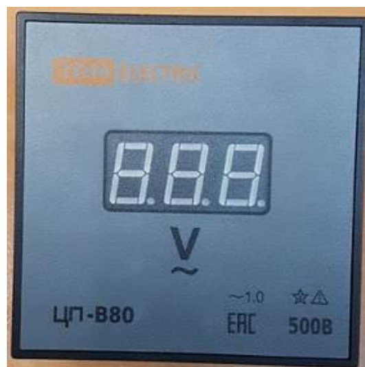
Рисунок 9 – Общий вид приборов ЦП-В80