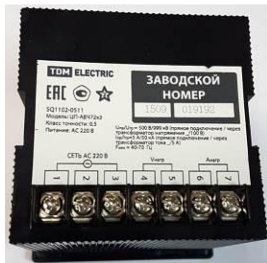
Рисунок 14 – Общий вид приборов ЦП. Вид сзади