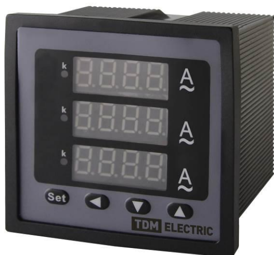
Рисунок 6 – Общий вид приборов ЦП-А72×3