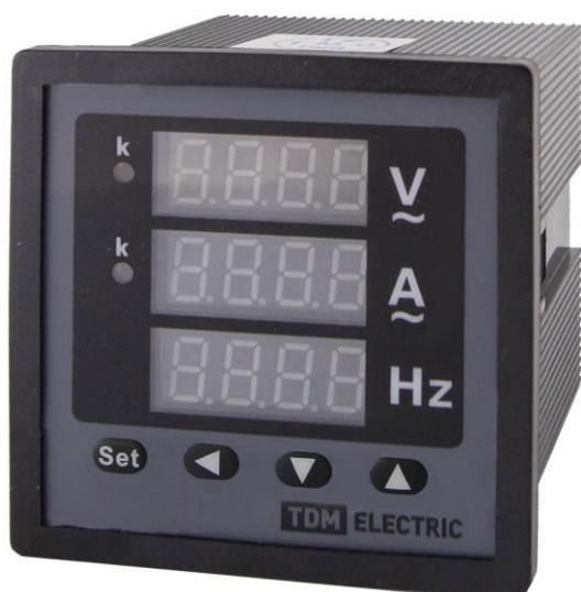
Рисунок 10 – Общий вид приборов ЦП-АВЧ72