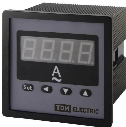
Рисунок 4 – Общий вид приборов ЦП-А72