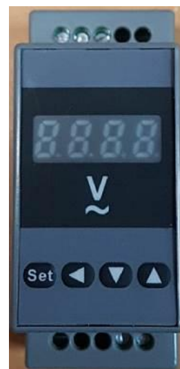
Рисунок 3 – Общий вид приборов ЦП-В45ПД