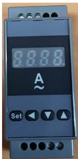
Рисунок 2 – Общий вид приборов ЦП-А45Д