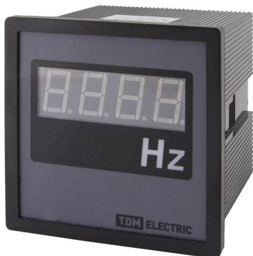
Рисунок 12 – Общий вид приборов ЦП-Ч72