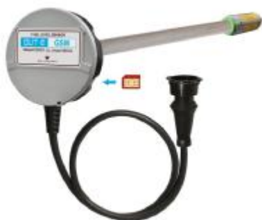
в) DUT-E GSM