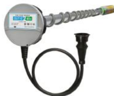
г) DUT-E 2Bio CAN, DUT-E 2Bio 232, DUT-E 2Bio 485, DUT-E 2Bio I, DUT-E 2Bio AF