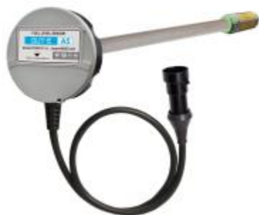
а) DUT-E A5, DUT-E A10, DUT-E F