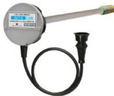
б) DUT-E CAN, DUT-E 232, DUT-E 485, DUT-E I, DUT-E AF