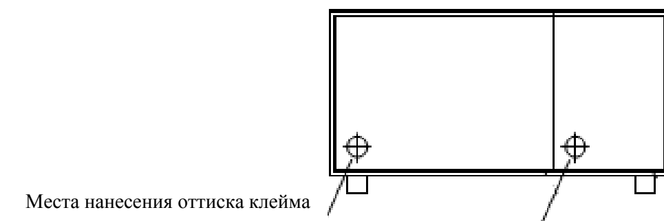
а) вид измерителей спереди