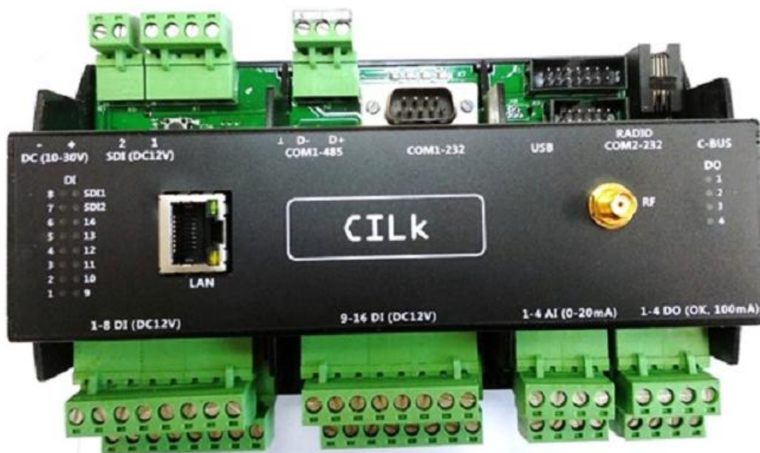
Рисунок 1 – Вид спереди ПЛК

Общий вид ПЛК и место нанесения знака поверки представлен на рисунке 2.