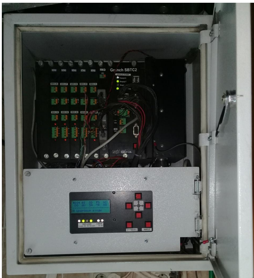
Рисунок 1 – Общий вид контроллеров модификации Granch SBTC2-2 (передняя дверца открыта)

Схема пломбировки от несанкционированного доступа, обозначение места нанесения знака поверки представлены на рисунке 3.