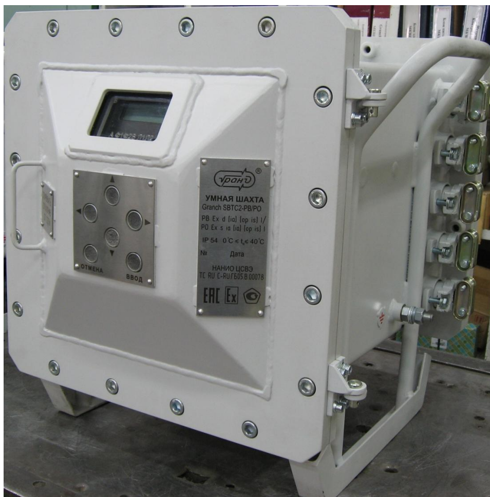
Рисунок 2 – Общий вид контроллеров модификации Granch SBTC2-PB/PO