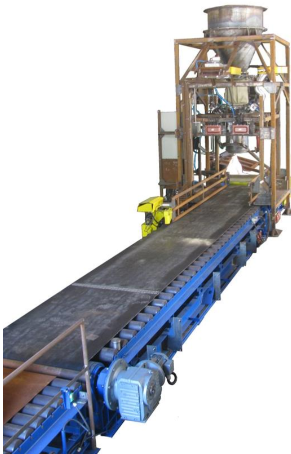
Рисунок 1 – Общий вид дозаторов весовые автоматические дискретного действия ПОИСК

Общий вид дозаторов представлен на рисунке 1.