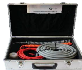
Рисунок 5 – Общий вид комплекта принадлежностей