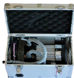
Рисунок 4 – Общий вид насоса