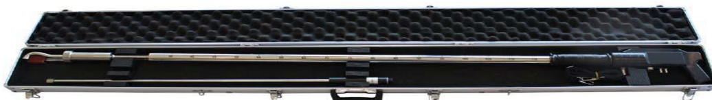
Рисунок 3 – Общий вид комплекта пробоотборных зондов