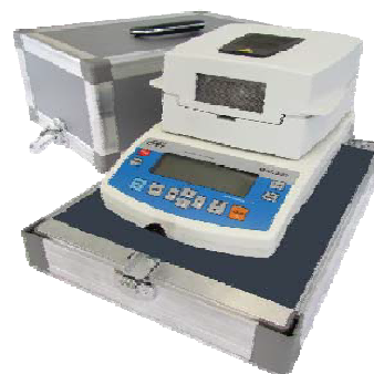
Рисунок 2 – Общий вид прецизионных весов