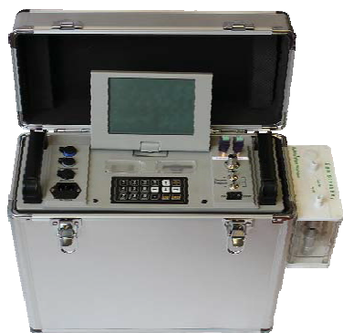
Рисунок 1 – Общий вид измерительного блока

Система GMD 13 состоит из измерительного блока (рисунок 1), прецизионных весов горячего взвешивания (рисунок 2), комплекта зондов разной длины для отбора твердых (взвешенных) частиц на фильтр и измерений скорости потока, температуры и давления в точке отбора пробы (рисунок 3), насоса для отбора пробы с расходом, обеспечивающим изокINETические условия при отборе пробы (рисунок 4) и комплекта принадлежностей (рисунок 5).