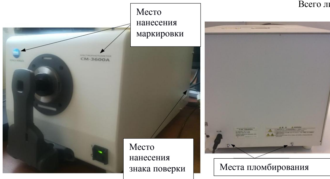
Рисунок 1 - Общий вид спектрофотометра Konica Minolta модели CM-3600A и CM-3700A с обозначением мест нанесения маркировки, знака поверки, схемой пломбировки от несанкционированного доступа