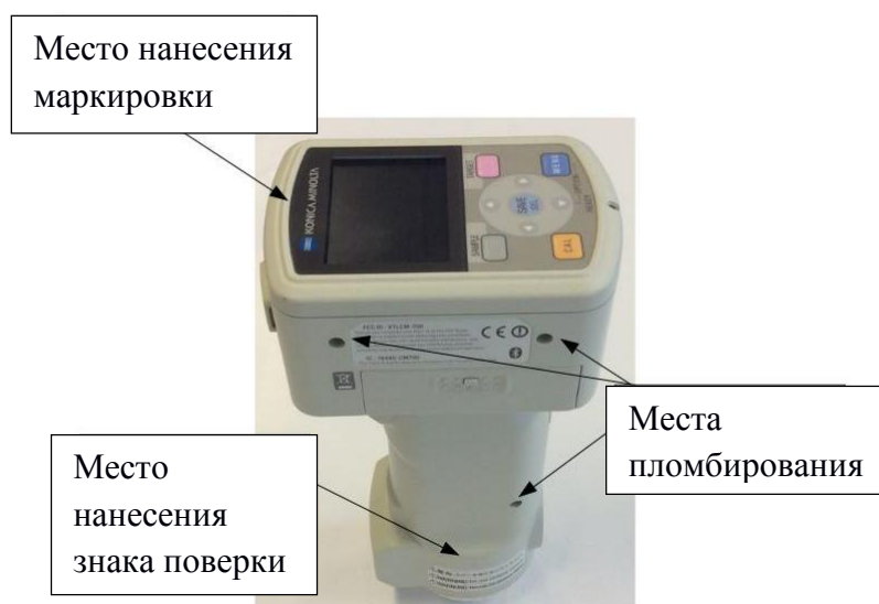
Рисунок 4 – Общий вид спектрофотометров Konica Minolta модели CM-600d и CM-700d с обозначением мест нанесения маркировки и знака поверки, а также схема пломбировки от несанкционированного доступа