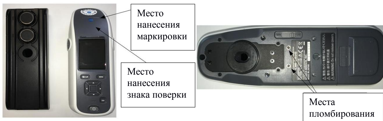
Рисунок 5 - Общий вид спектрофотометра Konica Minolta модель CM-25cG с обозначением мест нанесения маркировки, знака поверки и схема пломбировки от несанкционированного доступа