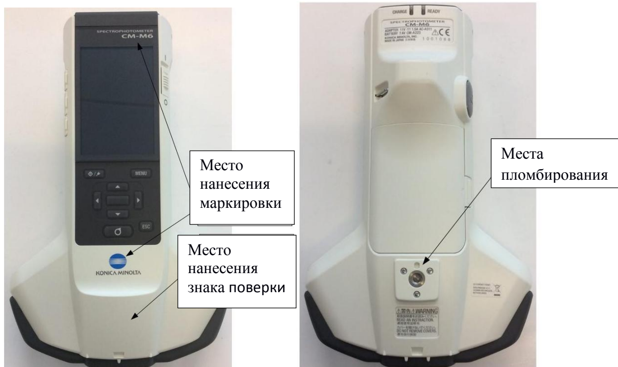
Рисунок 6 - Общий вид спектрофотометра Konica Minolta модель CM-M6 с обозначением мест нанесения маркировки, знака поверки и схема пломбировки от несанкционированного доступа