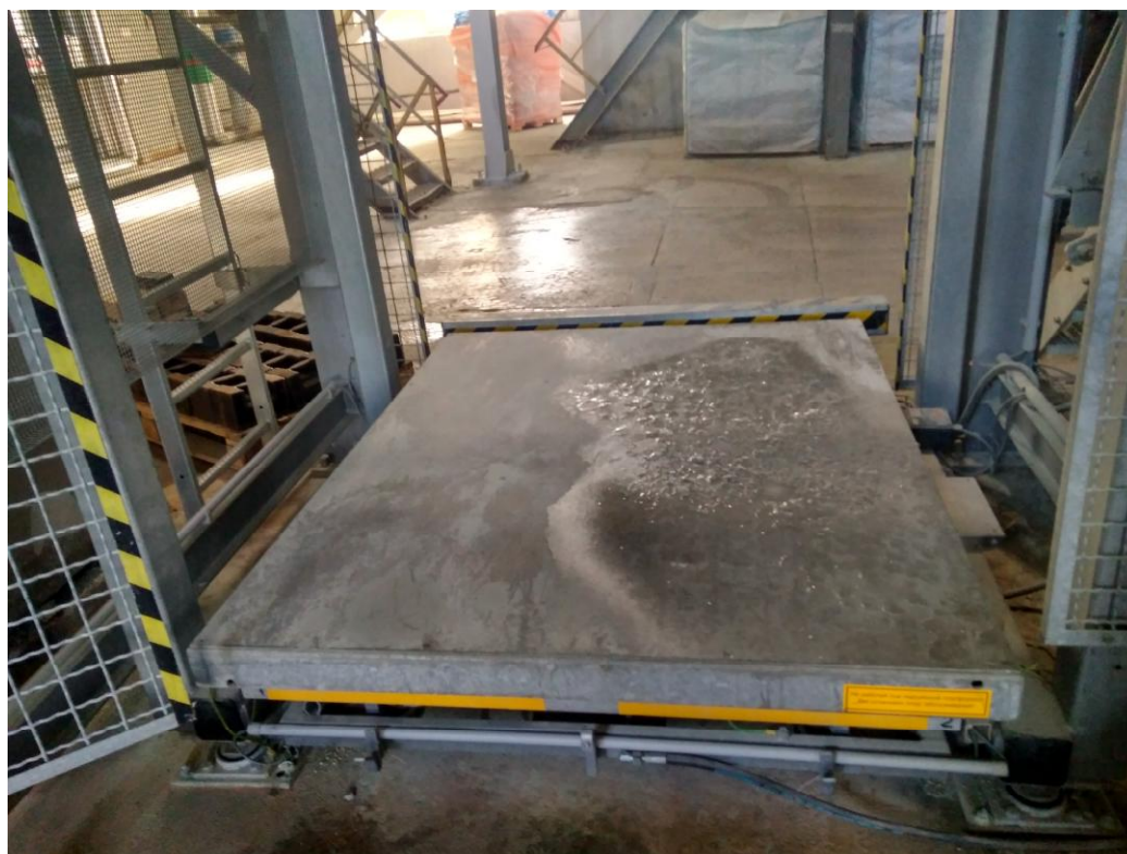
Рисунок 1 - Общий вид ГПУ весов