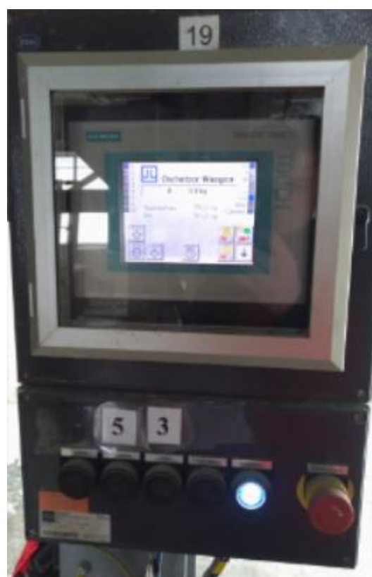
Рисунок 2 – Общий вид интерфейса ТР 177В