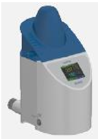
Рисунок 1 - Общий вид анализатора мутности модели LabScat 2

Схема пломбировки от несанкционированного доступа, обозначение места нанесения знака поверки на анализаторы представлены на рисунках 3 и 4.