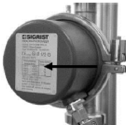
Место пломбировки Место нанесения знака поверки