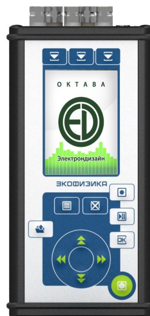
Рисунок 2 – лицевая панель модели ЭКОФИЗИКА-110А в исполнении «HF»