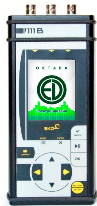
Рисунок 3 – лицевая панель модели ЭКОФИЗИКА-111В