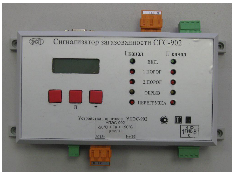
а) устройство пороговое двухканальное УПЭС-902