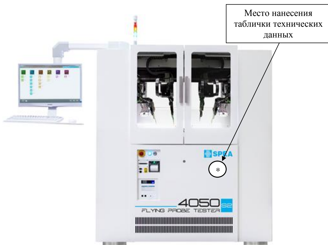
Рисунок 1 – Общий вид систем SPEA 4020, SPEA 4050S2 FBL

Пломбирование систем электрического контроля с летающими пробниками SPEA 4000, SPEA 4000S2 не предусмотрено.