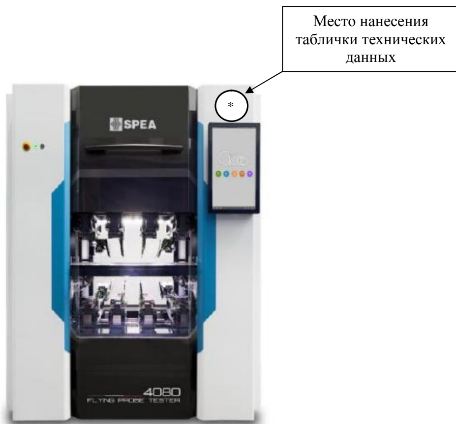
Рисунок 3 – Общий вид систем SPEA 4080