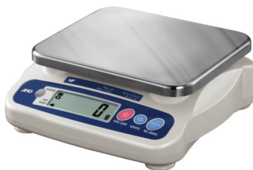
Рисунок 1 – Общий вид весов NP

Весы снабжены следующими устройствами (в скобках указаны соответствующие пункты ГОСТ OIML R 76-1-2011):