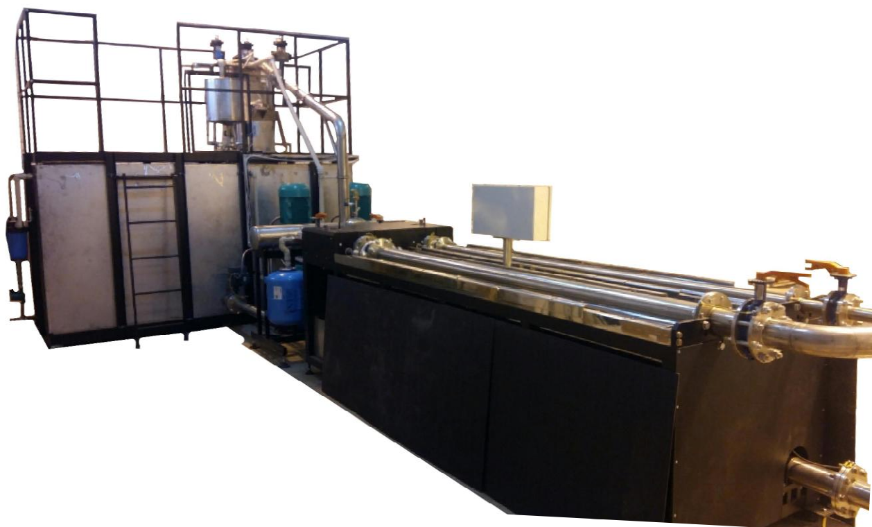
Рисунок 1 – Общий вид установок поверочных ТЕСТ-РС

Общий вид установок поверочных ТЕСТ-РС представлен на рисунке 1 и 2.